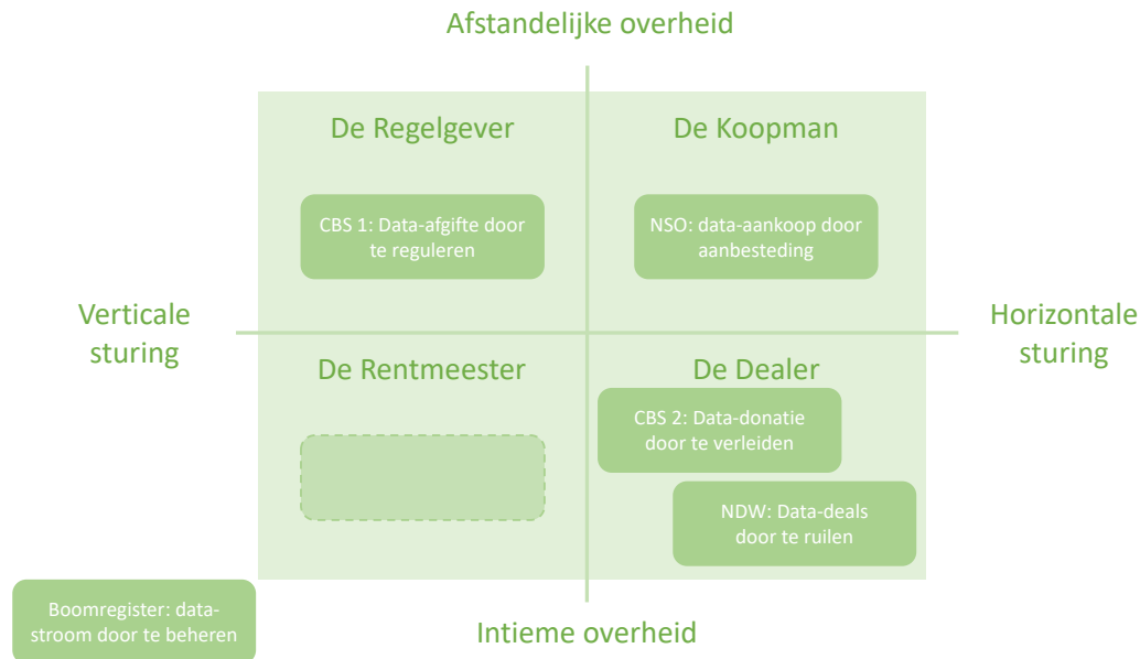
Figuur 2: Positie van case studies

Deze verkrijgingsmodellen zijn gebaseerd op fundamenteel verschillende interventietypen lopend van verticaal - de overheid reguleert door middel van publiekrechtelijke bevoegdheden en er is geen (warme) band met de derden - tot aan horizontaal en intiem: de overheid kent de derden goed en maakt als private partij afspraken. Dat schept in feite een matrix met 4 kwadranten waarbij ieder kwadrant correspondeert met een rol die de overheid kan vervullen (bij het laten stromen van data van derden). Afbeelding 2 hieronder positioneert de cases in deze matrix. 15 16